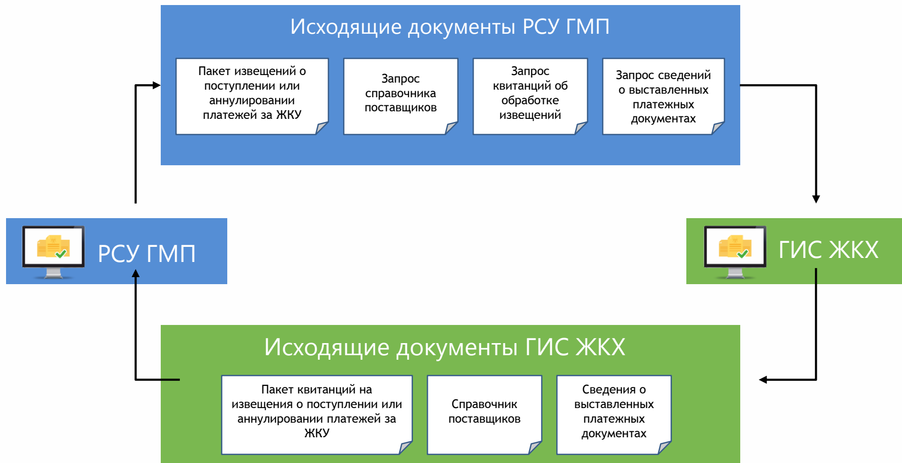
СХЕМА ВЗАИМОДЕЙСТВИЯ РСУ ГМП С ГИС ЖКХ