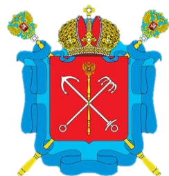
Комитет государственного финансового контроля Санкт-Петербурга