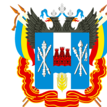
Контрольно-ревизионное управление Министерства финансов Ростовской области