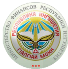
Ревизионный отдел Министерства финансов Республики Ингушетия