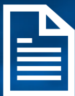
Локальная система делопроизводства