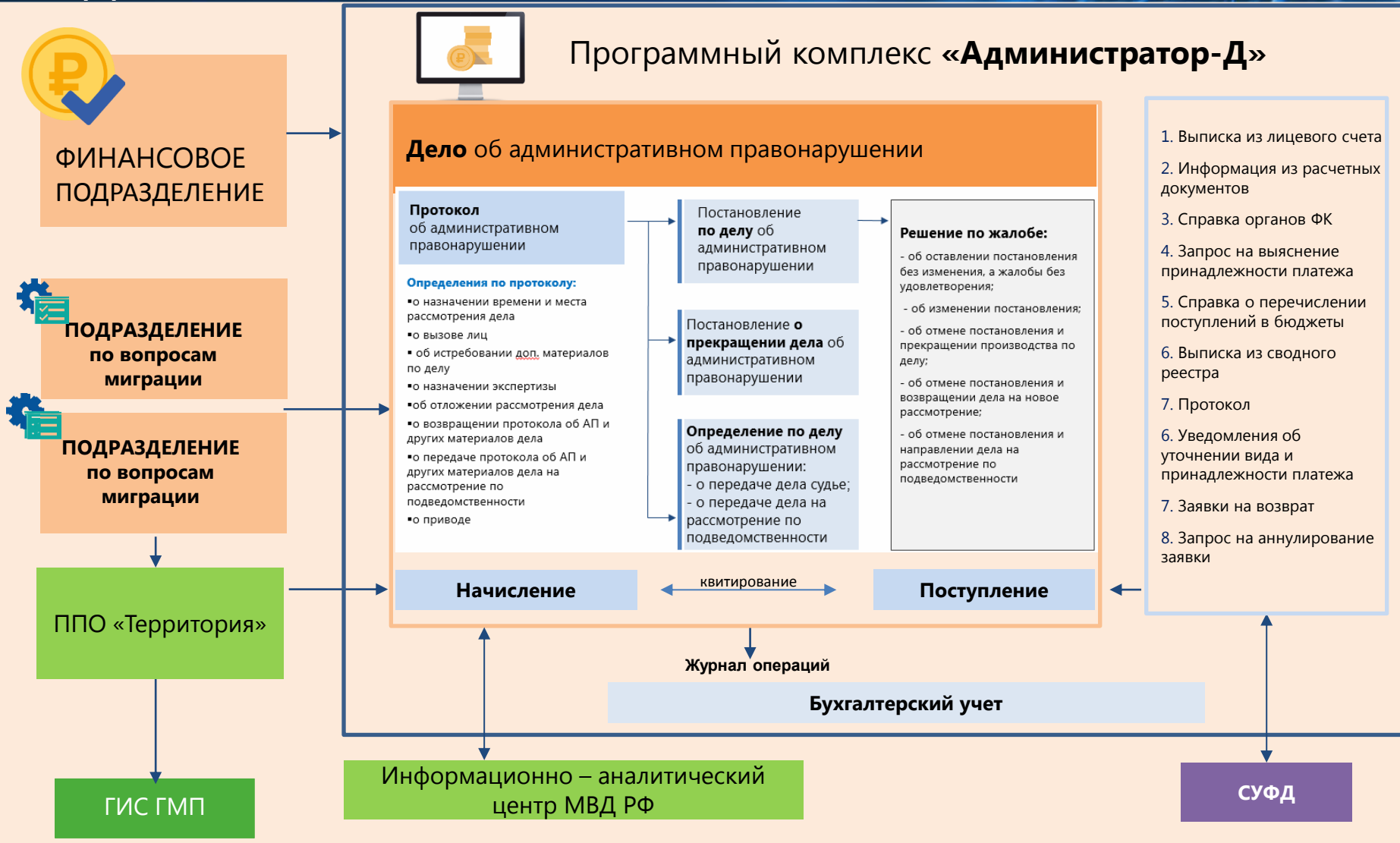
СХЕМА ДОКУМЕНТООБОРОТА ПОДРАЗДЕЛЕНИЙ ПО ВОПРОСАМ МИГРАЦИИ С ИСПОЛЬЗОВАНИЕМ МОДУЛЯ «АДМИНИСТРАТИВНАЯ ПРАКТИКА»