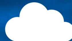
Взаимодействие с ГИС ГМП