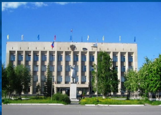
Управление финансов Администрации Ковдорского муниципального района Мурманской области