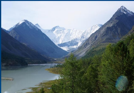
Министерство финансов Республике Алтай