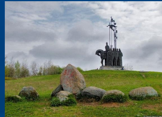
Главное государственное финансовое управление Псковской области