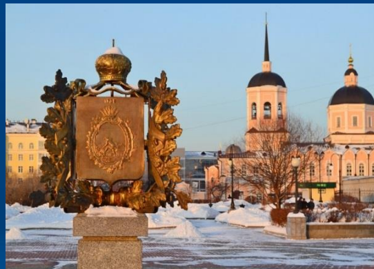
Департамент экономики Администрации Томской области