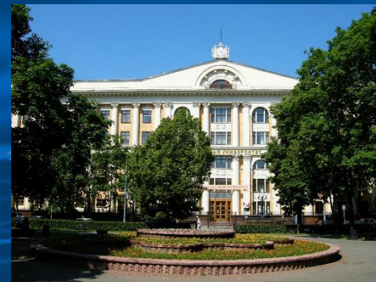
Финансовый университет при Правительстве РФ