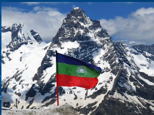
Министерство экономического развития Карачаево-Черкесской Республики