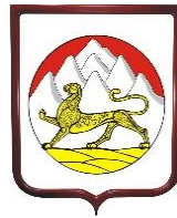
Республика Северная Осетия - Алания